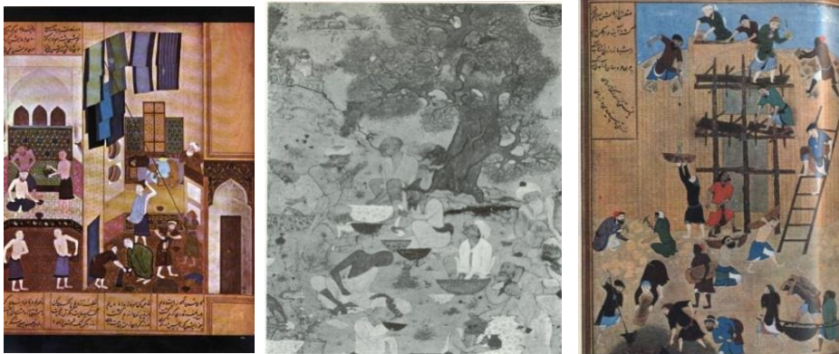
"ساختمان قلعه و قصرخورنق" "مأمون در حمام"، "کمال‌الدین بهزاد" "گلگشت" از محمدی

اجتماعی را به کل نگاره بخشیده است، تا آنجا که حتی بدون دانستن نام مینیاتور، بیننده فکر می‌کند با تصویری از واقعه‌ای حقیقی از محیط بیرون روبرو است، هر چند که روح معنوی و جهان تخیل گرای آن را هرگز نمی‌توان نادیده گرفت. این درحالی است که تابلوی گلگشت اثر محمدی (۱۵۸۷-۱۶۲۹)، در ذات موضوع (تفریح و گلگشت درویش‌ها) واقع‌گرایانه و عینی است، اما در شیوه پرداخت، رویکردی فراواقع و تخیلی برگزیده است. این تابلو که درویش‌هایی را در حالت جذب و خلسه به تصویر کشیده است «رنالیستی است» که از طریق احساس به وجود آمده و در واقع رنالیسم ذات موضوع است نه صورت ظاهر آن.» (گری، ۱۳۸۳: ۴۱-۴۰).